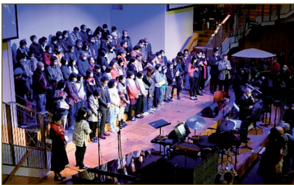
呼召决志者到台前，牧师带他们决志祷告的一刻

佈道会在12月3日假于播道会恩福堂举行实体佈道聚，超过一千人参加，看见神使用佈道会，藉着诗歌颂唱与见证分享，彰显神的大爱，将人冰冷的心溶化，带领有30位新朋友信主！10位愿认识主更多！2位基督徒愿意重新立志跟随主。圣诞音乐佈道会并于12月26日在网上播放。