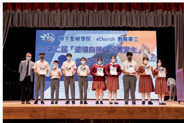
图为生活营中获赠奖学金学生

精兵！有学生在生活营中深受激励，有不少得着（详情请参本刊其他分享），也有学生回应希望下届活动他们可以协助筹备、担任司仪、领诗、带活动或游戏等工作。总而言之，是希望可以积极参与！这回应给我们极大的鼓舞。我们会积极探讨开办一些可以培育他们起来事奉的课程。若他们都接受装备、并且起来一起事奉，那影响力将会是何等惊人！